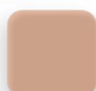
Sombra de dunas